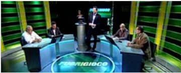
CARITAS INSIEME - "Dal mercato alla gratuità"

INDEX - Conseguenze della crisi su euro e borse