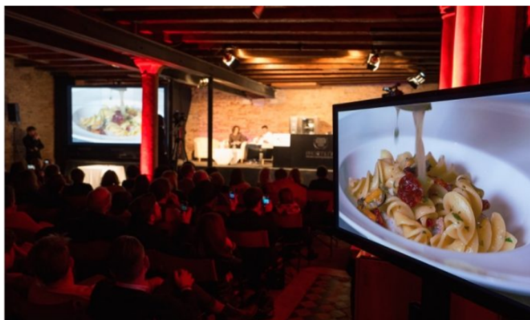
Gusto in Scena