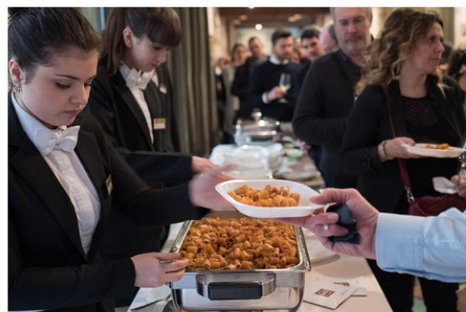
Gusto in Scena sta studiando associazioni tra le diverse erbe e le loro reazioni ai vari utilizzi