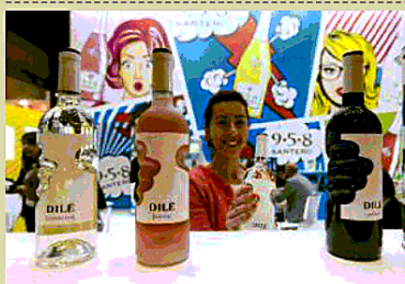
Le originali bottiglie con la presa facilitata, una delle novità