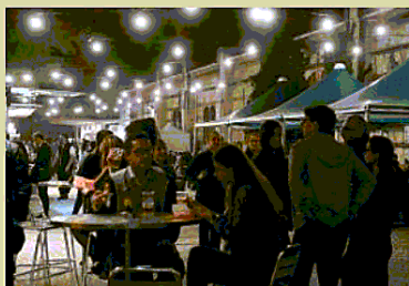
La rassegna Biologic in corso fino a oggi all'Arsenale