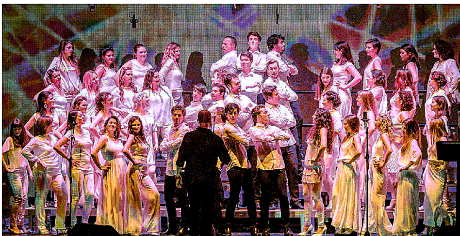
I Vocal Skyline saranno sabato in concerto al teatro Goldoni (nella foto a sinistra)