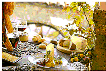
In mostra a Venezia i migliori formaggi veneti

Domani e lunedì 24 aprile alla Scuola Grande di San Giovanni Evangelista si tiene la nona edizione di "Gusto in scena", Regione Veneto e Veneto Agricoltura presentano grazie a Caseus Veneti i migliori formaggi del panorama caseario regionale. L'evento proporrà a operatori e gourmet - come avviene da otto anni - una serie di degustazioni di vini e assaggi di eccellenze gastronomiche della migliore produzione italiana e internazionale, mentre ristoranti e alberghi si confronteranno sul tema "La cucina del senza e le erbe aromatiche". Il Veneto, con Caseus Veneti, mette in vetrina alcuni dei suoi migliori formaggi, frutto del lavoro di tanti allevatori che ogni giorno consegnano il latte a un centinaio di caseifici regionali o lo trasformano direttamente.