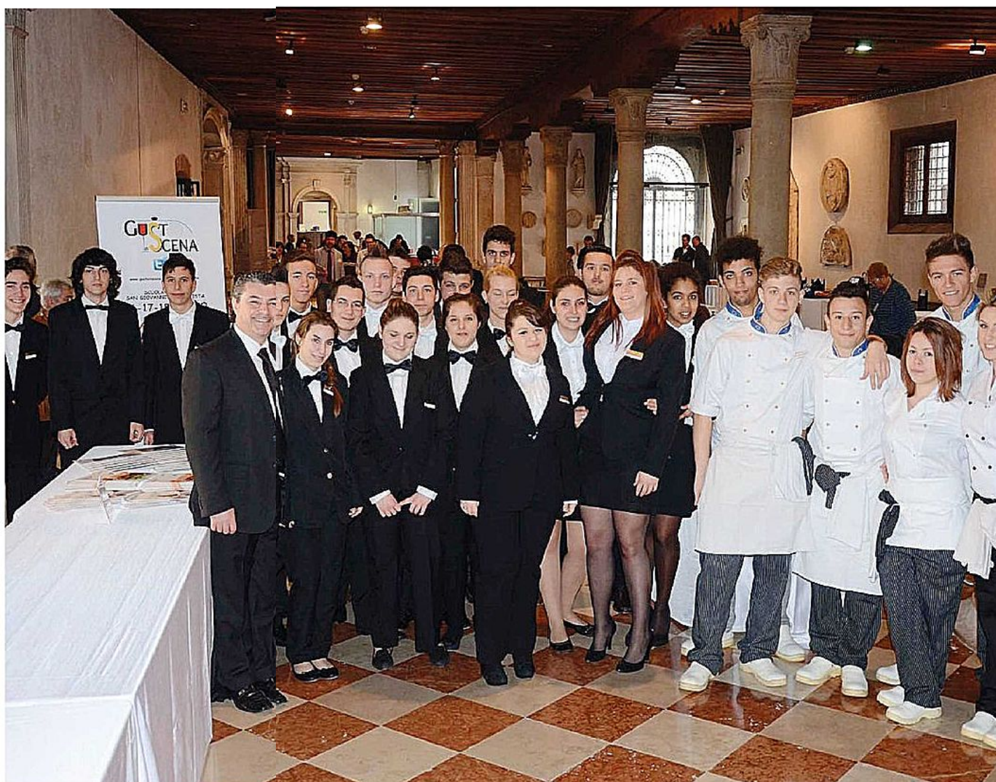
Lo staff di cuochi di tutte le età di "Gusto in scena" Sotto, lo chef Carlo Cracco