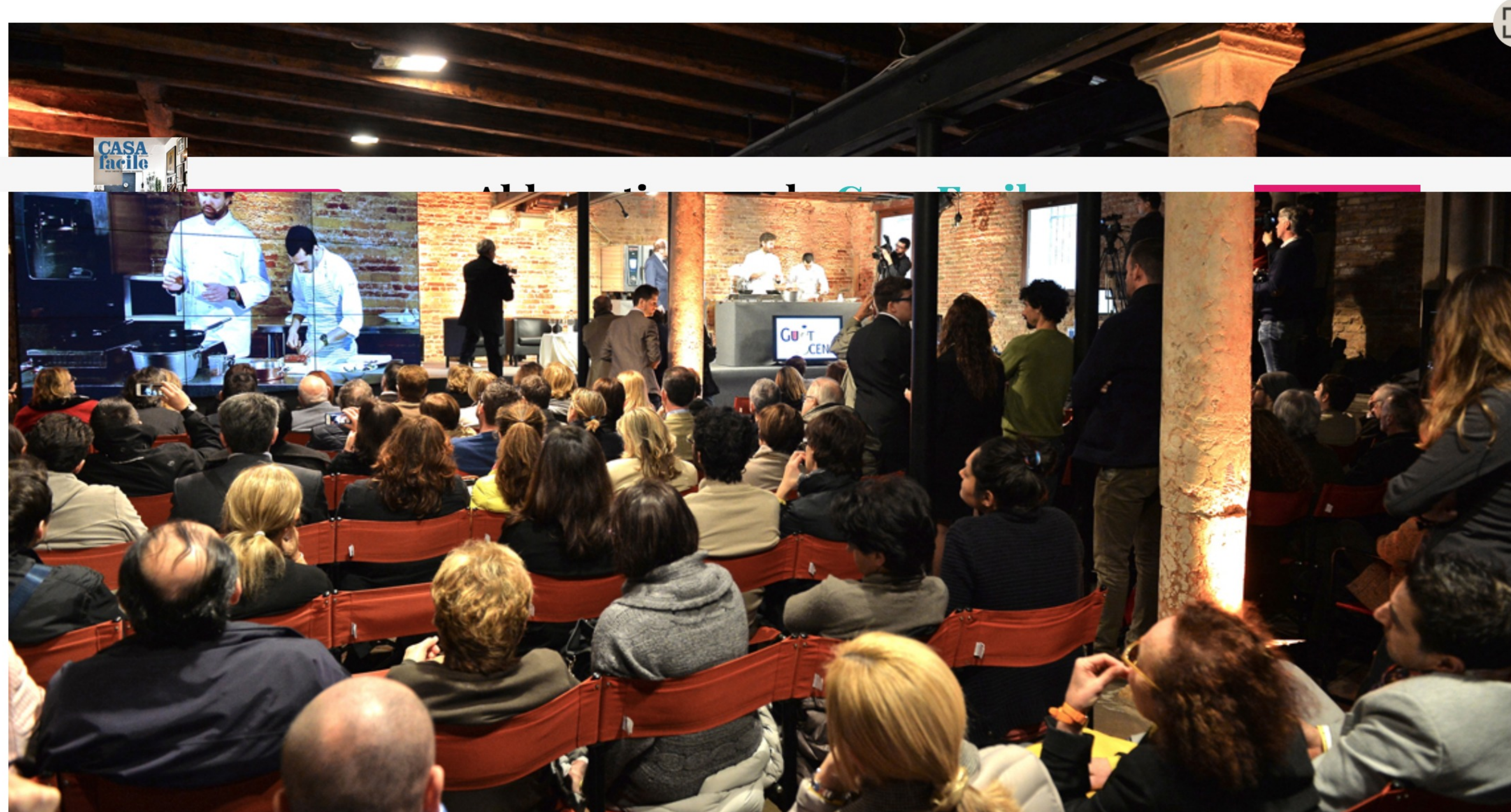
Il Congresso di Alta Cucina con Carlo Cracco.