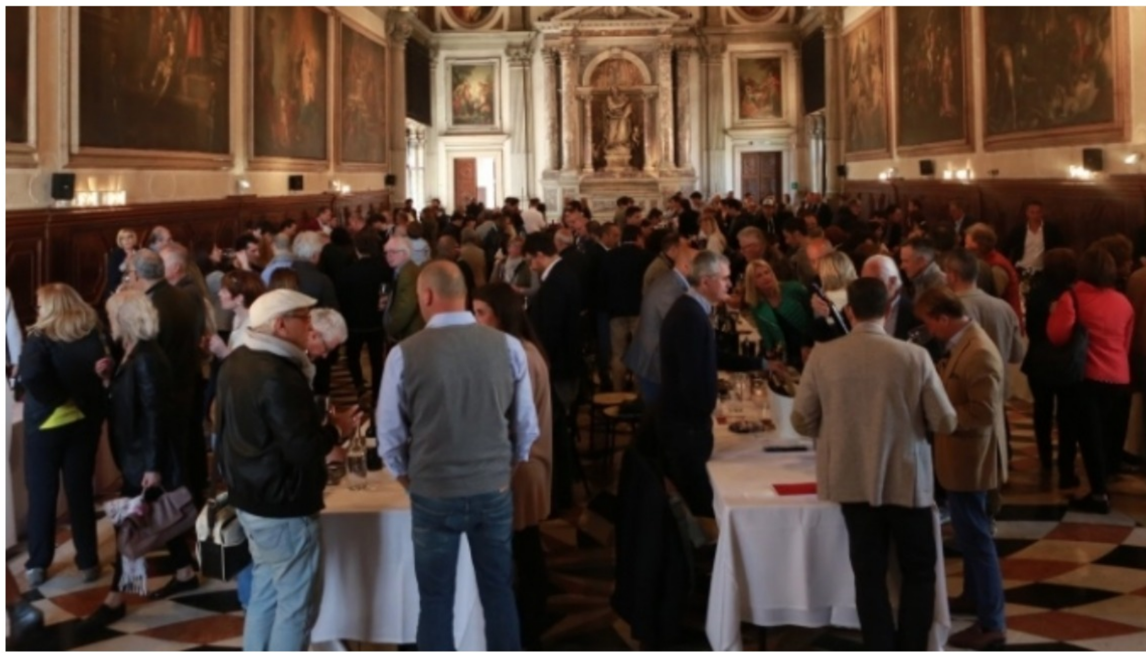
I Magnifici Vini Gis

🕒 5 dicembre 2017 ➔ CUCINA E DINTORNI, I NOSTRI CONSIGLI DI NATALE, MAGAZINE